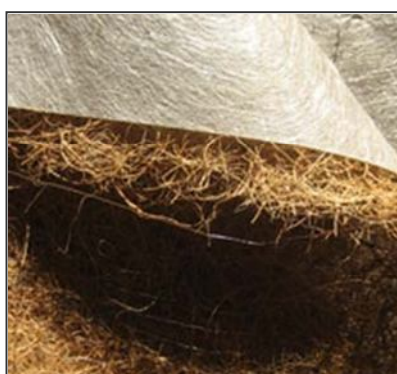
Manta orgánica de fibras de coco con lámina plástica fotodegradable que permite la aireación del suelo permeabilidad del suelo.