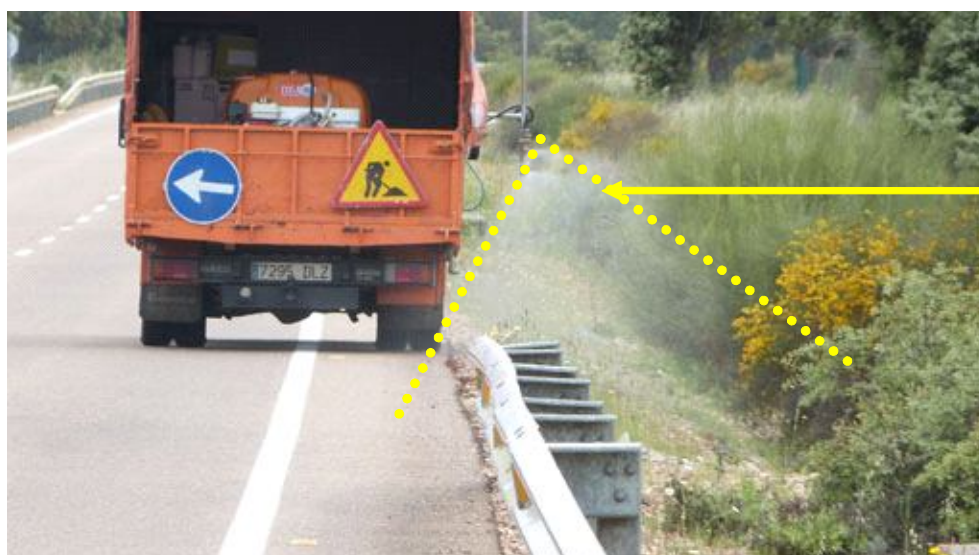
Imagen 8 – Método utilizado para la aplicación de herbicida en carreteras.

Aplicación del herbicida con afecciones a flora y fauna