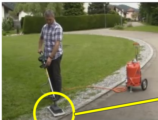
Imagen 3 – Quemado por infrarrojo.