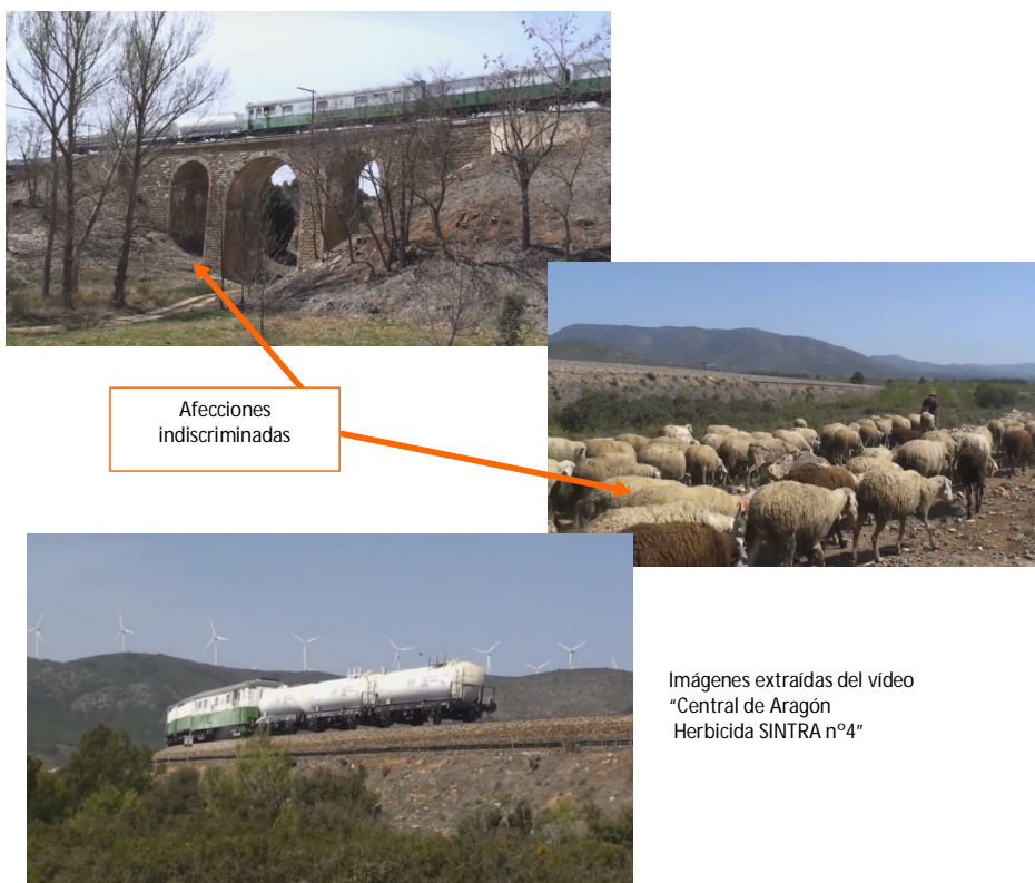
Imagen 11: La aplicación del herbicida afecta negativamente a flora y fauna del entorno.