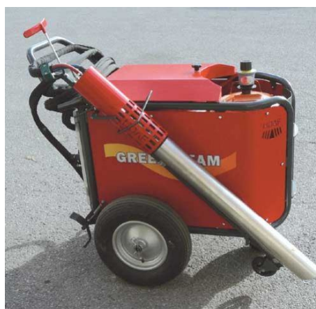
Imagen 7 – Deshidratadora de agua caliente (2). Tratamiento en suelos pavimentados y de arena, aplicación con boquillas específicas.