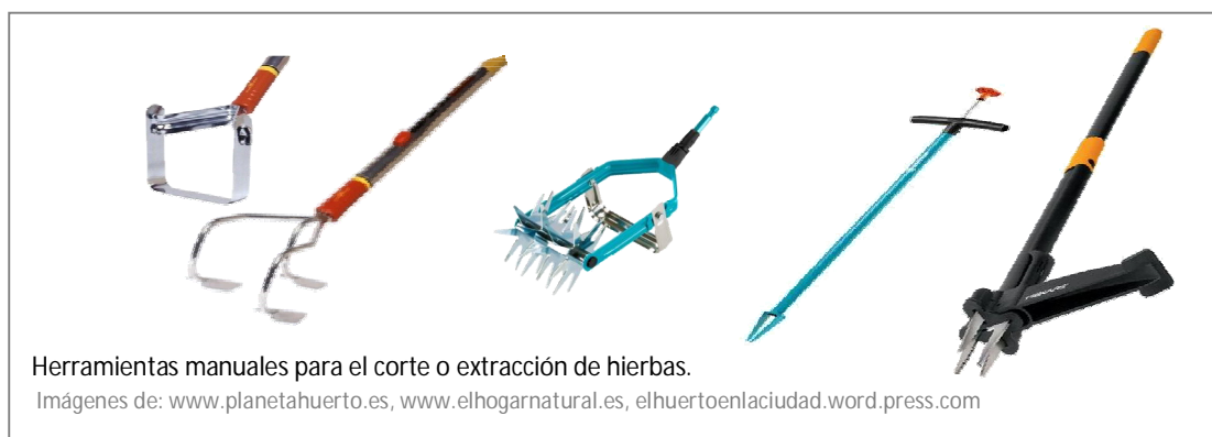
Imagen 1 – Herramientas manuales para la extracción o el corte de hierbas.