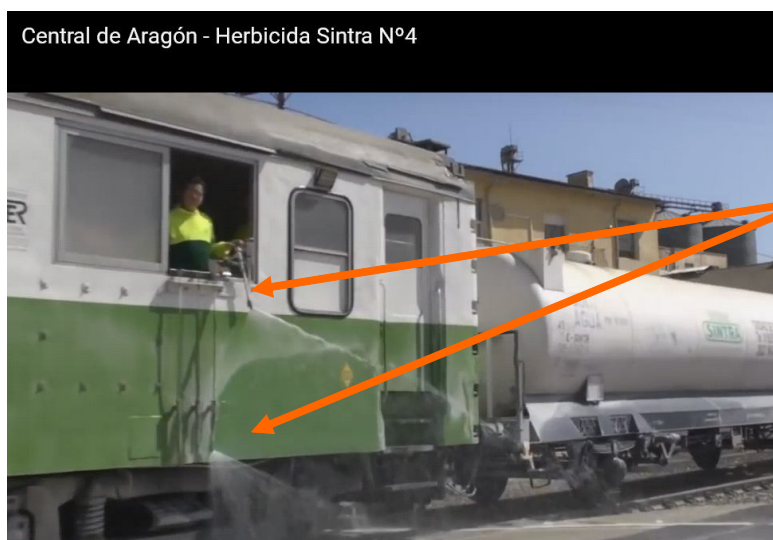
Imagen 10: Tren Herbicida en Aragón para el control de la vegetación con glifosato.

Aplicación de glifosato: Una pistola a presión dirigida manualmente (ángulo variable) y varias bocas fijas en la parte inferior.