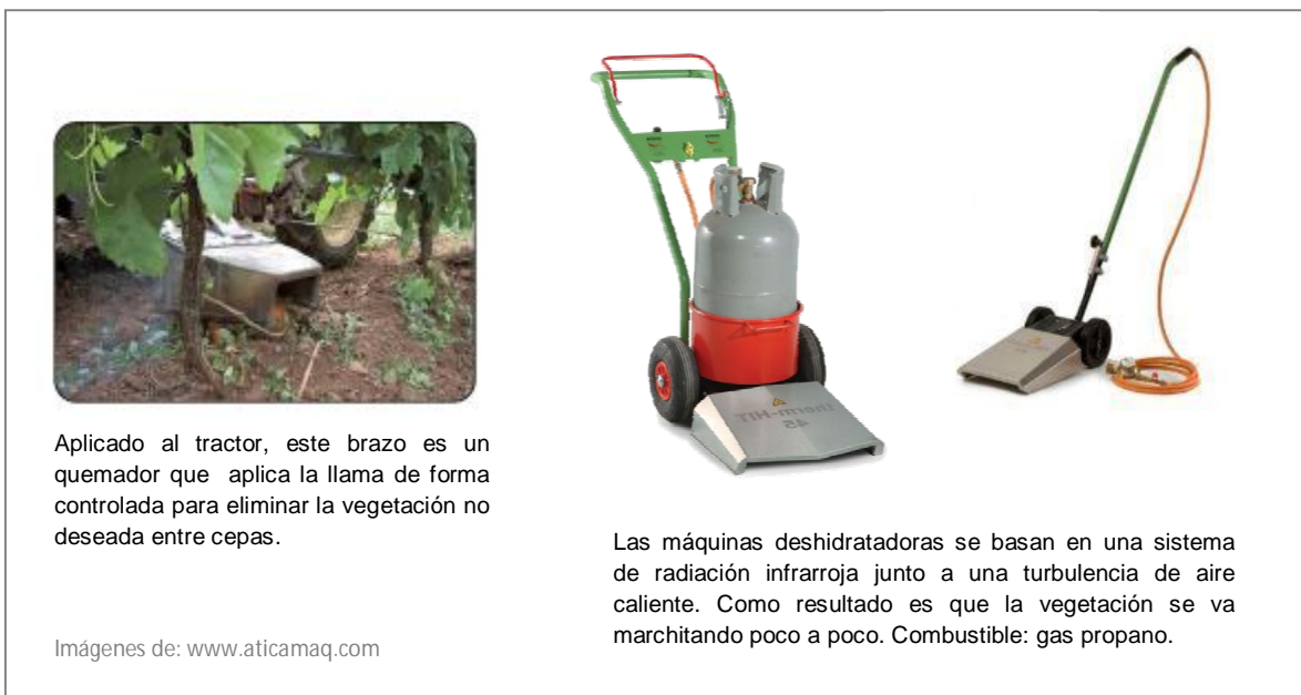
Imagen 2- Flameado o quemado con aire.

Aplicado al tractor, este brazo es un quemador que aplica la llama de forma controlada para eliminar la vegetación no deseada entre cepas.