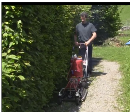
Imagen 4 – Quemador con carro aplicador.