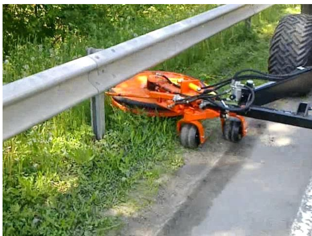
Desbrozadora mecánica en cuneta con señalización vial.