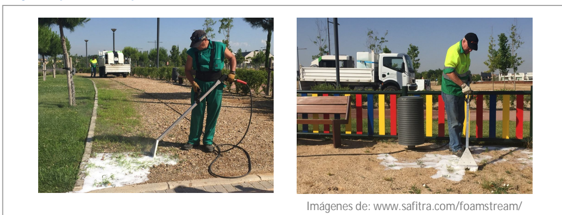
Imagen 5. Aplicación de espumas sobre firme de tierra.